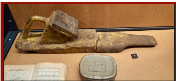
Sabot d'enrayage utilisé pour les déraillements